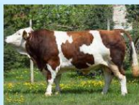
HEVIN BB Burek