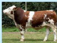
MASIV Pp Sikora